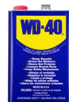
WD-40® GALÓN (1 Galón, 5 Galones y 55 Galones)